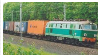
Rail Freight Transport