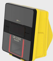
EM316MQ Čtečka QR kódu