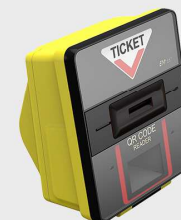
EM316MOQ Označovač se čtečkou QR