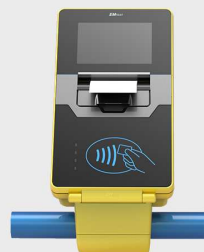
EM216Fprl Zařízení All in one Tiskárna s displejem a čtečkou ČK i QR