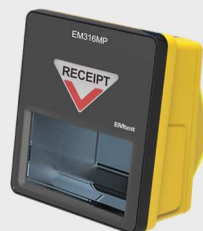
EM316MP/MO Tiskárna / označovač